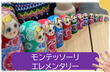
モンテッソーリ・エレメンタリー